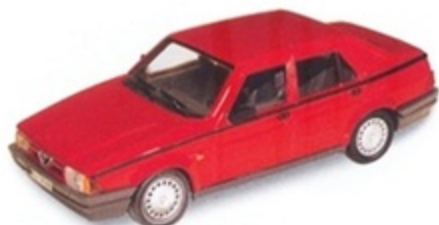
PK 190 - Alfa Romeo 75 1600 Stradale - 1987