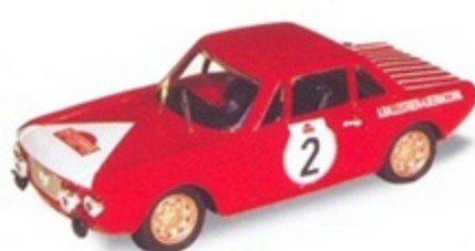
PK 086 - Lancia Fulvia Coupè HF 1600 Rally Sanremo - 1973