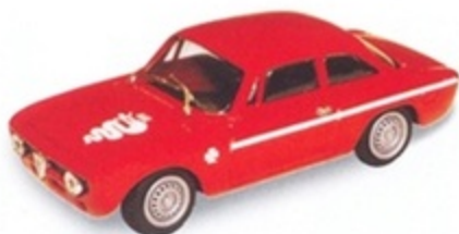
PK 061 - Alfa Romeo Giulia GTAJ Presentazione - 1965