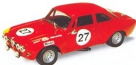
PK 2052 - Alfa Romeo Giulia GTAM Spa - 1972