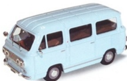
PK 480A - Fiat 850 Familiare Minibus Stradale Celeste