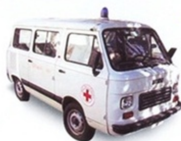
PK 534 - Fiat 900 T Familiare Croce Rossa Italiana - 1975