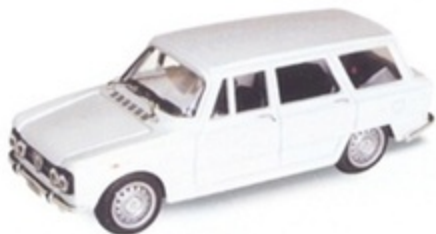
PK 400 - Alfa Romeo Nuova Giulia Fam. Colli Stradale - 1970