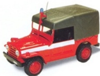
PK 457 - Fiat AR 54 Campagnola Vigili Del Fuoco - 1970