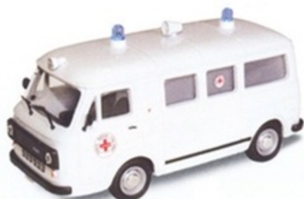
PK 374 - Fiat 238 E Ambulanza Croce Rossa Italiana - 1970