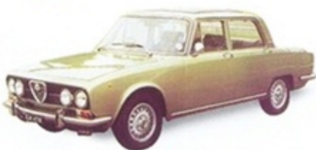
PK 361 - Alfa Romeo 2000 Berlina 1968 - Grigio Met.