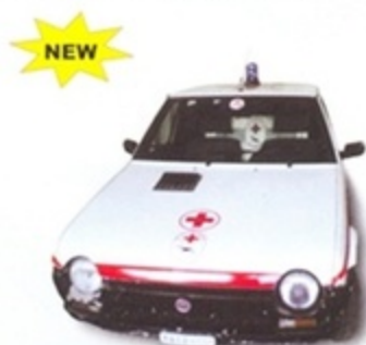
PK 445 - Fiat Ritmo 60 5 Porte Croce Rossa Italiana - 1978