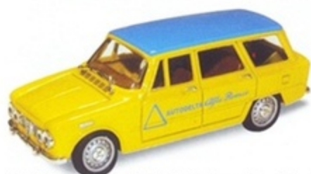
PK 173C - Alfa Romeo Giulia SW Assistenza Autodelta - 1971