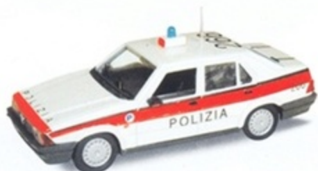
PKC 015 - Alfa Romeo 75 Polizia Svizzera - 1977