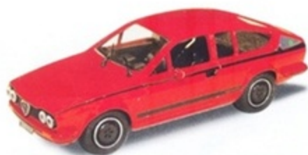
PK 253 - Alfa Romeo Alfetta GTV Grand Prix Stradale - 1981