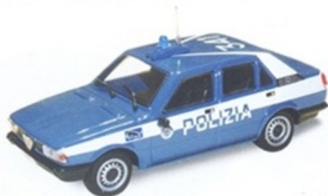
PK 271 - Alfa Romeo Giulietta Polizia - 1977