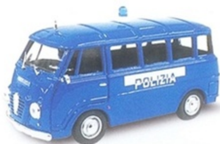
PK 312- Alfa Romeo Romeo 2 Pulmino Polizia - 1969