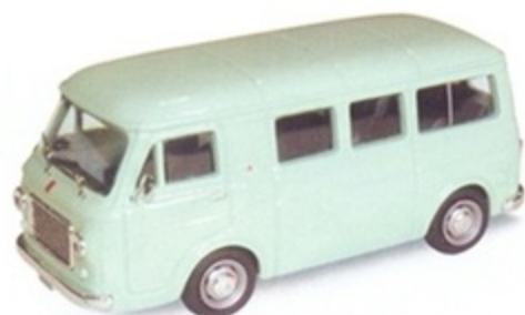
PK 340 - Fiat 238 Pulmino Stradale - 1965