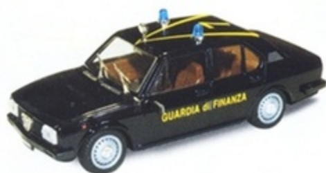
PK 248 - Alfa Romeo Alfetta 2000 Guardia Di Finanza - 1978