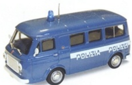
PK 342A - Fiat 238 Pulmino Polizia - Polizi - 1970