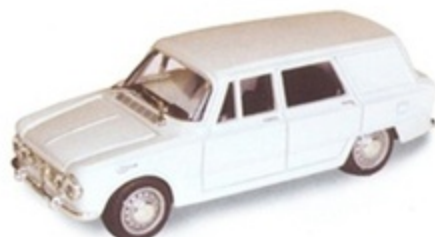
PK 171 - Alfa Romeo Giulia Van Colli Stradale - 1965