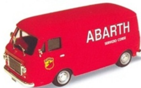
PK 355 - Fiat 238 Furgone Assistenza Corse Abarth - 1970