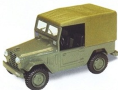
PK 474 - Alfa Romeo AR 51 Matta Polizia - 1960