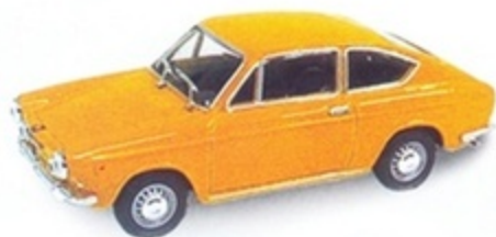
PK 295 - Fiat 850 Sport Coupè II Serie Stradale - 1968