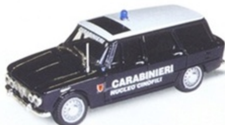
PK 176 - Alfa Romeo Giulia Break Carabiniere Cinifili - 1970