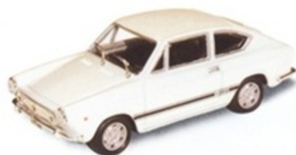
PK 296 - Fiat Abarth 1300 Sport Coupè Stradale - 1968 Bianco