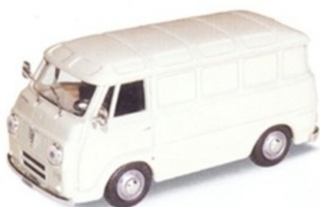
PK 320 - Alfa Romeo Romeo F12 Furgone Stradale - 1960