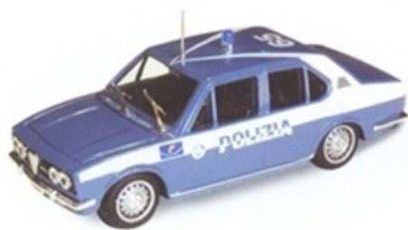
PK 215A - Alfa Romeo Alfetta 1800 Polizia Autostrade - 1975