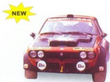
PK 268 - Alfa Romeo Alfetta GTV 6 Gr 4 Sanremo - 1986