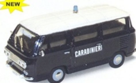
PK 481 - Fiat 850 Familiare Minibus Carabinieri - 1970