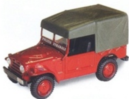
PK 453 - Fiat AR 54 Campagnola Polizia - 1950