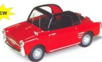
PK 510 - Autobianchi Bianchina Convertibile Open Rosso/Nero - 1958 PK 511 - Autobianchi Bianchina Convertibile Open Azzurra/Bianca - 1958 PK 512 - Autobianchi Bianchina Convertibile Open Avorio/Rossa - 1958 PK 513 - Autobianchi Bianchina Convertibile Open Rosso - 1958