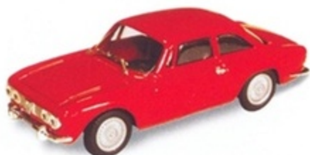
PK 091 - Alfa Romeo Giulia GTV 2000 Stradale - 1972