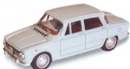
PK 099 - Alfa Romeo Giulia 1300 Super Stradale - 1967