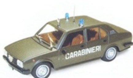
PK 241A - Alfa Romeo Alfetta 2000 Carabinieri Esercito - 1979