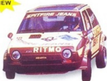
PK 427 - Fiat Ritmo Abarth GR.2 Spitfire Jeans Turismo - 1982