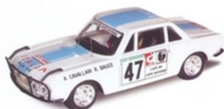
PK 2027 - Lancia Fulvia Coupè HF Rally Bandama - 1975