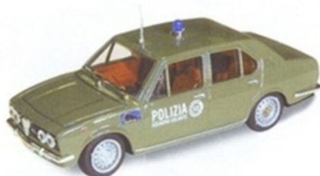
PK 211 - Alfa Romeo Alfetta 1800 Polizia - 1972