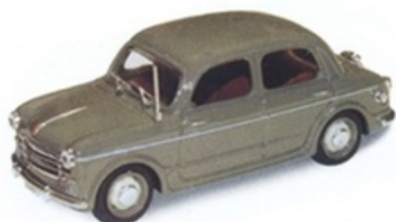
PK 184 - Fiat 1100/103 Polizia - 1955