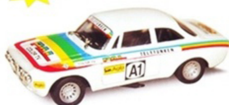
PKRAC 006 - Alfa Romeo Giulia GTAM "Telefunken" Kyalami - 1972