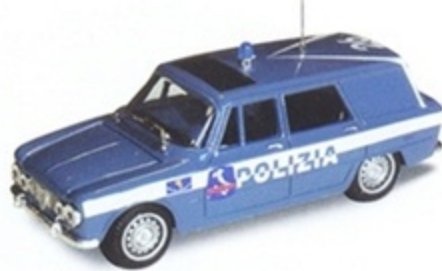
PK 172C - Alfa Romeo Giulia Break Polizia - 1970