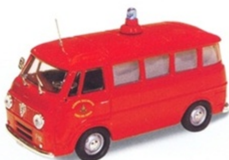
PK 334 - Alfa Romeo Romeo F12 Ambulanza Vigili Del fuoco - 1965