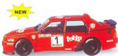
PK 2059 - Alfa Romeo 75 IMSA Rally Di Monza - 1990