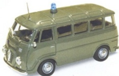
PK 314 - Alfa Romeo Romeo 2 Pulmino Polizia - 1960