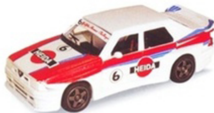
PKRAC 004 - Alfa Romeo 75 IMSA Heida Challenge Alfa