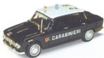
PK 108 - Alfa Romeo Giulia Super Carabiniere - 1968