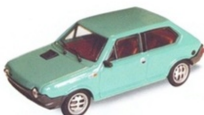
PK 420A - Fiat Ritmo 65 3 Porte Stradale - 1978 Verde