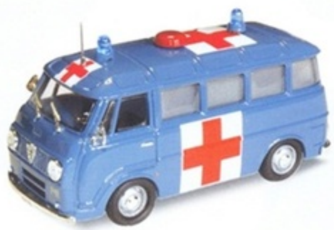
PK 339 - Alfa Romeo F12 Ambulanza Polizia - 1972