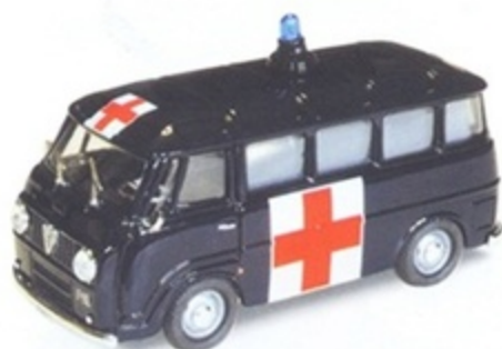
PK 336 - Alfa Romeo Romeo F12 Ambulanza Carabinieri - 1968