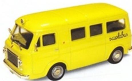
PK 344 - Fiat 238 Scuolabus - 1968