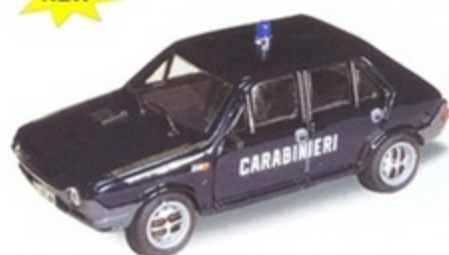
PK 441 - Fiat Ritmo 60 5 Porte Carabinieri - 1978