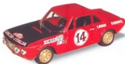
PK 084 - Lancia Fulvia Coupè HF 1600 1° Montecarlo - 1972