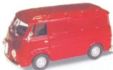
PK 300 - Alfa Romeo Romeo 2 Furgone Stradale - 1953