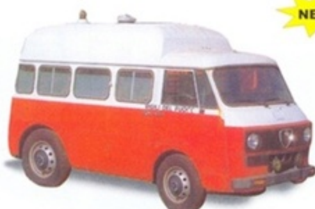
PK 324 - Alfa Romeo F12 Tetto Alto Ambulanza VDF - 1970