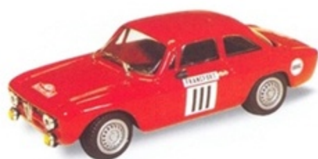
PK 2057 - Alfa Romeo Giulia GTA Montecarlo - 1967