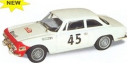
PK 2055 - Alfa Romeo Giulia GTV Rally Montecarlo - 1976