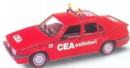
PKC 024 - Alfa Romeo 75 T.S. CEA Estintori - 1995