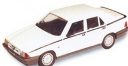
PK 191 - Alfa Romeo 75 1800 IE Stradale - 1987