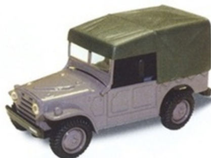
PK 458 - Fiat AR 54 Campagnola Guardia Di Finanza - 1960