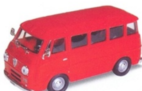
PK 330 - Alfa Romeo Romeo F12 Pulmino Stradale - 1960