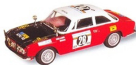
PKRAC 003 - Alfa Romeo GTV 2000 Safari Rally - 1976