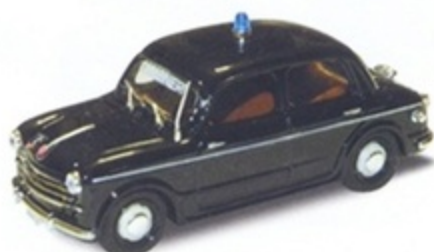
PK 183 - Fiat 1100/103 Carabiniere - 1960