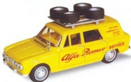
PK 173 - Alfa Romeo Giulia Break Assistenza Alfa Holland - 1967