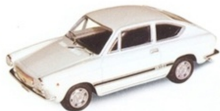
PK 293 - Fiat Abarth 1300 S Stradale - 1969