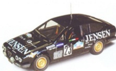
PK 2024 - Alfa Romeo Alfetta GTV/6 Jensen - 1983