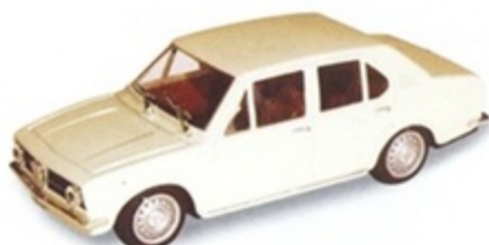
PK 220 - Alfa Romeo Alfetta 1600 Berlina Stradale - 1974