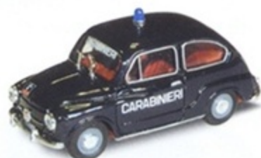
PK 231 - Fiat 750 D Carabiniere - 1967