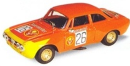
PK 2064 - Alfa Romeo Giulia GTM Jager - 1978