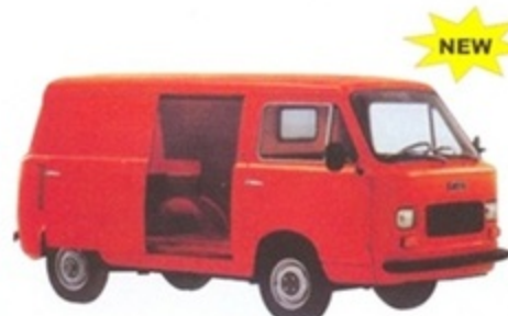
PK 540 - Fiat 900 T Furgone Stradale - 1975