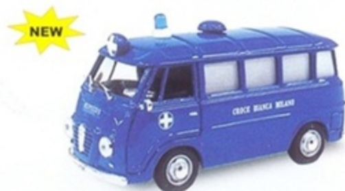
PKC 028 - Alfa Romeo Romeo 2 Croce Bianca Milano - 1960