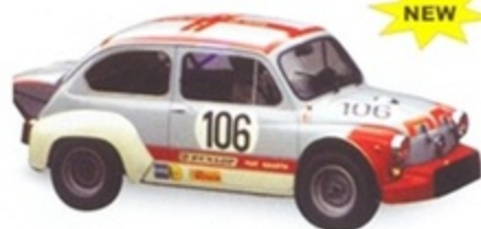
PK 2069 - Fiat Abarth 1000 TC Radiale Grosser Preis - 1973