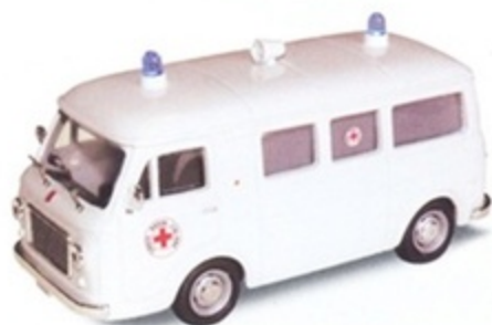
PKC 021 - Fiat 238 Croce Rossa Italiana - 1968