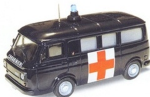
PK 372 - Fiat 238 E Ambulanza Carabinieri - 1970