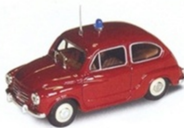
PK 157 - Fiat 600 D Polizia - 1960