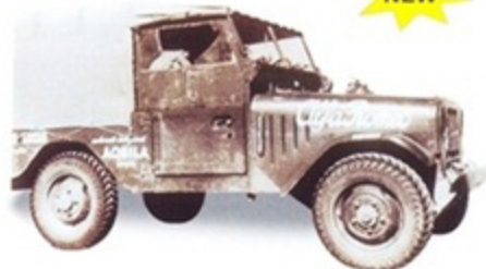
PK 477 - Alfa Romeo AR 51 Matta Raid Atlantico - Pacifico