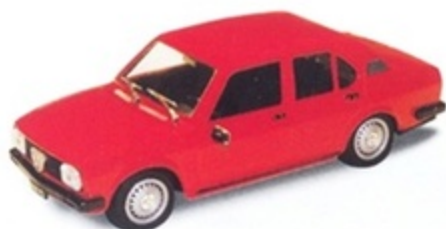
PK 240 - Alfa Romeo Alfetta 2000 Berlina Stradale - 1977