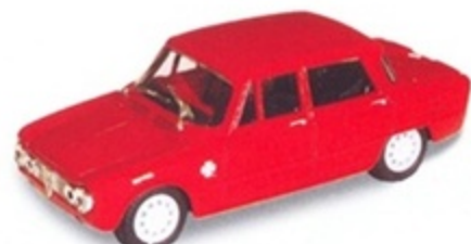
PK 104A - Alfa Romeo Giulia TI Super Ass. Corsa - 1964