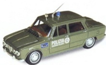
PK 101A - Alfa Romeo Giulia Berlina Polizia Squadra Volante - 1968