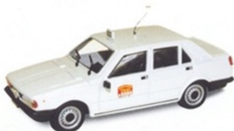
PK 272 - Alfa Romeo Giulietta Taxi Milano - 1977