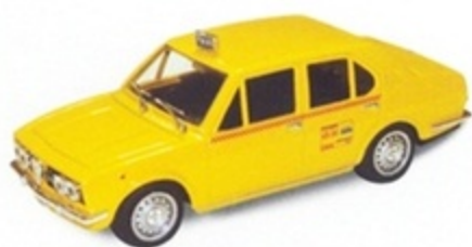
PK 214 - Alfa Romeo Alfetta 1800 Taxi Roma - 1972