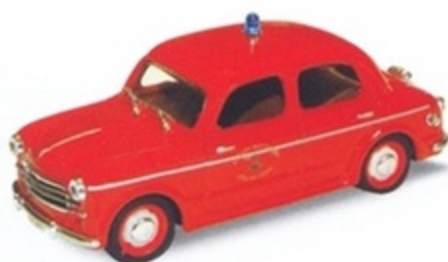
PK 185 - Fiat 1100/103 Vigili Del Fuoco - 1953