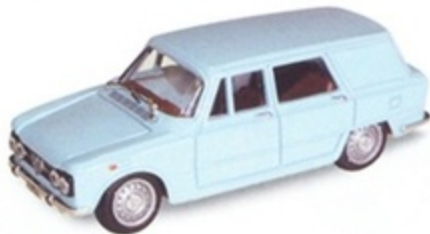
PK 402 - Alfa Romeo Nuova Giulia Van. Colli Stradale - 1970