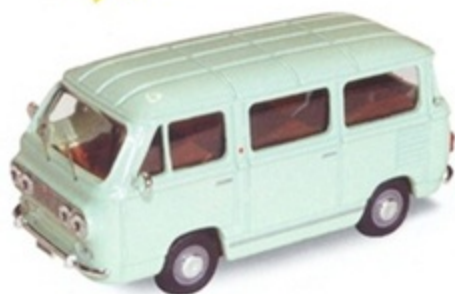
PK 480 - Fiat 850 Familiare Minibus Stradale Verde Chiaro