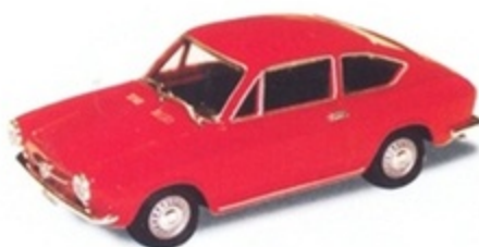
PK 280 - Fiat 850 Coupè Stradale - 1965