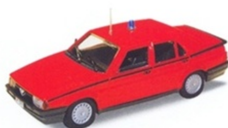
PK 196 - Alfa Romeo 75 Vigili Del Fuoco - 1987