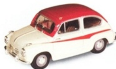
PK 235 - Fiat 600 Derivazione Abarth Stradale - 1957