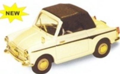
PK 525 - Autobianchi Bianchina Cabriolet Closed Rosso - 1960 PK 526 - Autobianchi Bianchina Cabriolet Closed Beige - 1960 PK 527 - Autobianchi Bianchina Cabriolet Closed Turchese - 1960