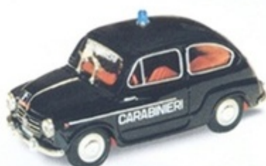
PK 151 - Fiat 600 D Carabiniere - 1965