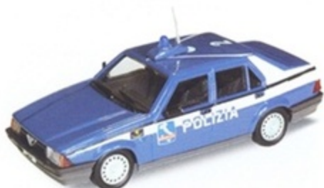
PK 194B - Alfa Romeo 75 Polizia Autostrade - 1987