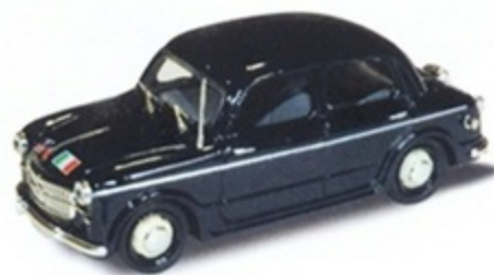
PK 183B - Fiat 1100/103 E Carabiniere Servizio Ufficiali - 1965