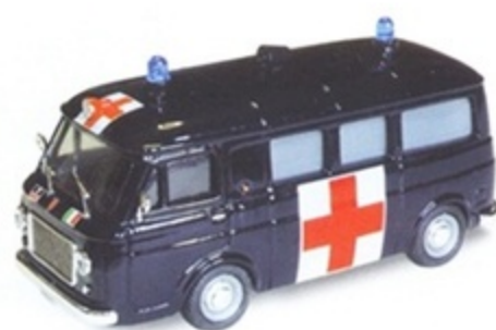
PK 348 - Fiat 238 Ambulanza Carabinieri - 1968