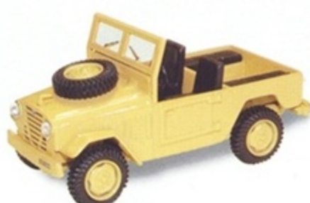
PK 470 - Alfa Romeo AR 51 Matta Stradale Open - 1951