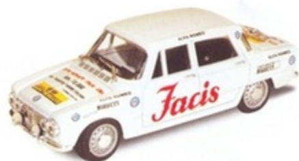
PK 2028 - Alfa Romeo Giulia TI Raid Della Fratellanza - 1968