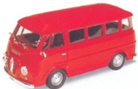
PK 310 - Alfa Romeo Romeo 2 Pulmino Stradale - 1954