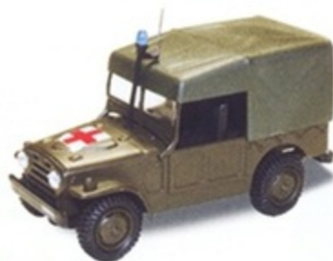
PK 459 - Fiat Campagnola AR 54 Ambulanza Militare - 1970