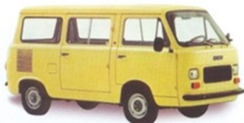
PK 530 - Fiat 900 T Minibus Stradale 1975