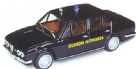
PK 216 - Alfa Romeo Alfetta 1800 Guardia di Finanza - 1975