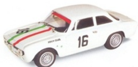
PK 067 - Alfa Romeo Giulia GTA Mugello - 1966