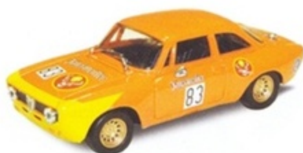
PK 2037 - Alfa Romeo Giulia GTM Jager - 1978