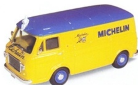
PK 357 - Fiat 238 Furgone Michelin - 1965