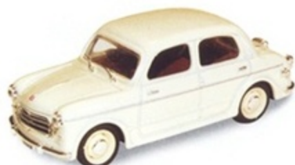
PK 180 - Fiat 1100/103 Stradale - 1953