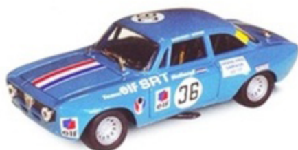
PKRAC 002 - Alfa Romeo GTM SRT Holland Zandvoort - 1972