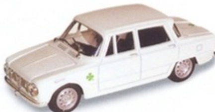
PK 104 - Alfa Romeo Giulia TI Super Presentazione - 1964