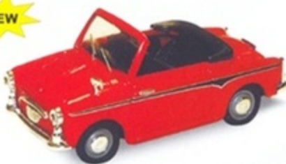
PK 520 - Autobianchi Bianchina Cabriolet Open Bianca - 1960 PK 521 - Autobianchi Bianchina Cabriolet Open Rosso - 1960 PK 522 - Autobianchi Bianchina Cabriolet Open Azzurra - 1960