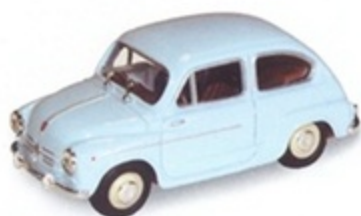
PK 150 - Fiat 600D Stradale - 1960