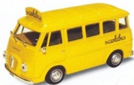
PK 317 - Alfa Romeo Romeo 2 Scuolabus - 1960