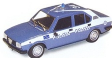
PK 245 - Alfa Romeo Alfetta 2000 Polizia - Polizi - 1977