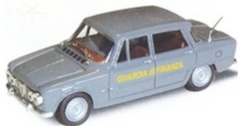
PKC 006 - Alfa Romeo Giulia Guardia Di Finanza - 1965