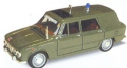
PK 176A - Alfa Romeo Giulia Break Carabiniere - 1965