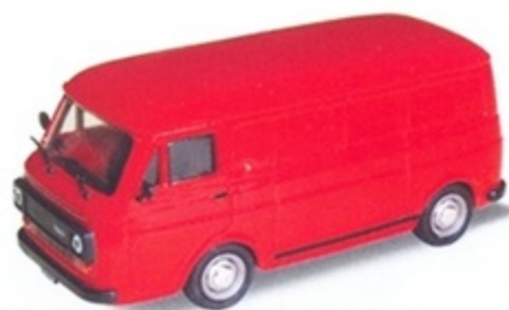
PK 380 - Fiat 238 E Furgone Stradale - 1970