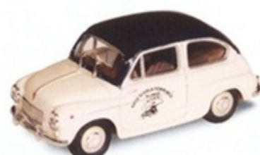
PKC 030 - Fiat 600 D Scioneri Scuola Guida Femminile - 1960