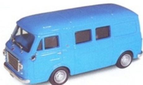
PK 346 - Fiat 238 Promiscuo Stradale - 1965