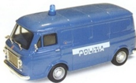
PK 352 - Fiat 238 furgone Polizia - 1969