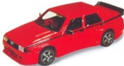
PK 410 - Alfa Romeo 75 Evoluzione IMSA Presentazione - 1980