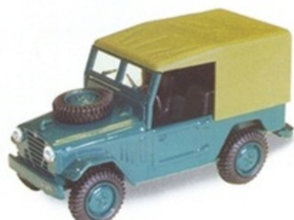
PK 471 - Alfa Romeo AR 51 Matta Stradale Closed - 1951