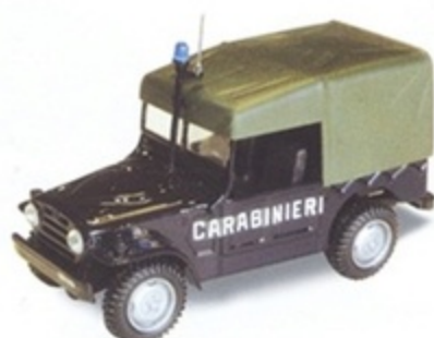
PK 452 - Fiat AR 54 Campagnola Carabinieri - 1968