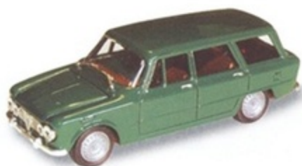
PK 170 - Alfa Romeo Giulia Familiare Colli Stradale - 1965