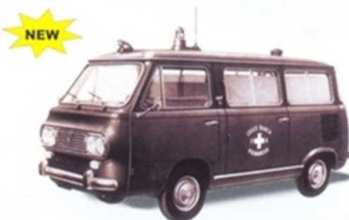
PK 485 - Fiat 850 Familiare Ambulanza - 1968