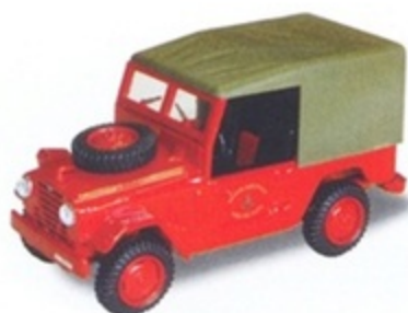
PK 476 - Alfa Romeo AR 51 Matta Vigili Del Fuoco - 1952