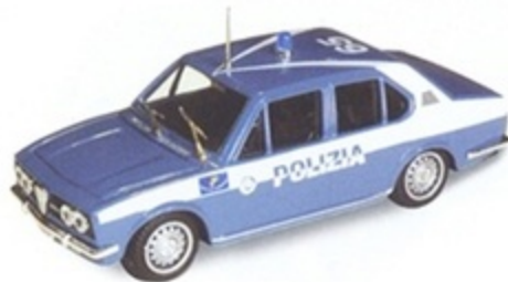
PK 215 - Alfa Romeo Alfetta 1800 Polizia - 1975