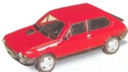
PK 422 - Fiat Abarth 1256 TC Stradale - 1979 Rosso