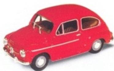
PK 230 - Fiat 750 D Stradale - 1967