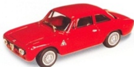
PK 042 - Alfa Romeo Giulia GTA Presentazione - 1965