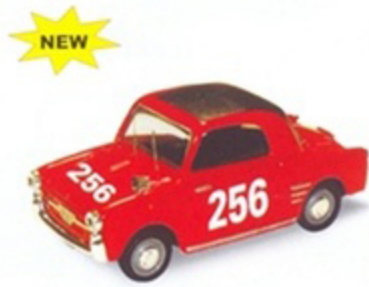
PK 2067 - Autobianchi Bianchina Corv. Stallavera - Bosco - 1959