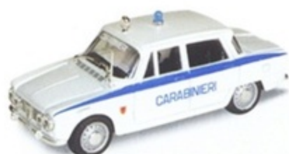
PK 108F - Alfa Romeo Giulia Carabiniere Prova Colore - 1968