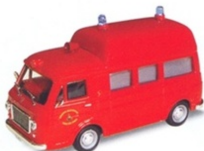
PK 391 - Fiat 238 Tetto Alto Ambulanza Vigili Del Fuoco - 1970