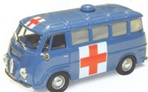
PK 313 - Alfa Romeo Romeo 2 ambulanza Polizia - 1969