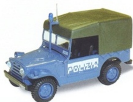
PK 456 - Fiat AR 54 Campagnola Polizia - 1970