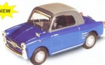
PK 515 - Autobianchi Bianchina Convertibile Closed Blue/Grigio - 1958 PK 516 - Autobianchi Bianchina Convertibile Closed Rosso/Nero - 1958 PK 517 - Autobianchi Bianchina Convertibile Closed Azzurra/Blu - 1958 PK 518 - Autobianchi Bianchina Convertibile Closed Celeste - 1958