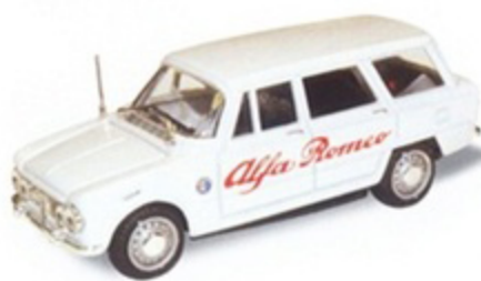
PK 173A - Alfa Romeo Giulia SW Assistenza Alfa - 1971