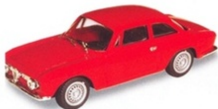
PK 041 - Alfa Romeo Giulia GT Stradale - 1963