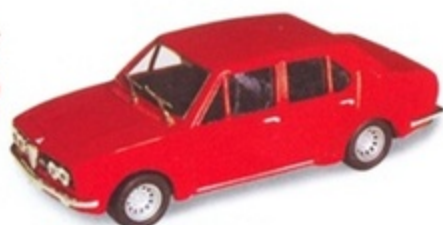
PK 221 - Alfa Romeo Alfetta Berlina GR2 Presentazione - 1974