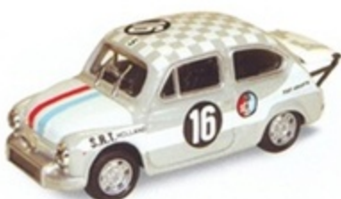
PK 2053 - Fiat Abarth 1000 GR. 5 European Cham. - 1970