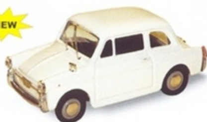
PK 500 - Autobianchi Bianchina Berlina - Bianco - 1962 PK 501 - Autobianchi Bianchina Berlina - Rossa - 1962 PK 502 - Autobianchi Bianchina Berlina - Verde - 1962 PK 503 - Autobianchi Bianchina Berlina - Celeste - 1962