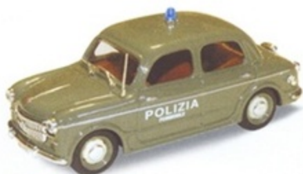
PK 184D - Fiat 1100/103 Polizia Femminile - 1955