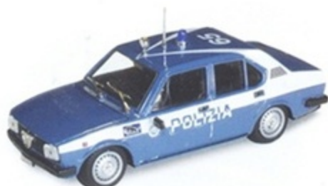
PK 242 - Alfa Romeo Alfetta 2000 Polizia - 1977