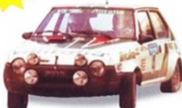
PK 428 - Fiat Ritmo Abarth GR.2 Alitalia Montecarlo - 1979