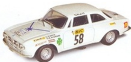
PK 2038 - Alfa Romeo Giulia GTAM TDF - 1970