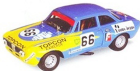
PKRAC 001 - Alfa Romeo GTM Topcon Racing - 1972

Edizione Limitata 600 Pz. - Limited Edition 600 Pcs.