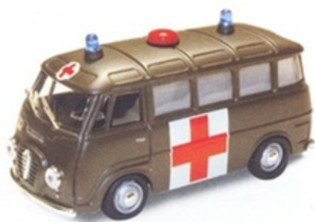
PK 315 - Alfa Romeo Romeo 2 Ambulanza Esercito - 1955