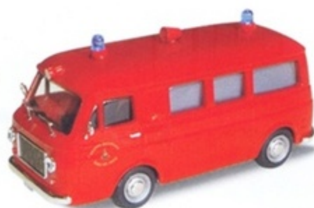
PK 349 - Fiat 238 Ambulanza Vigili Del Fuoco - 1965