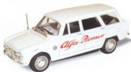
PK 173A - Alfa Romeo Giulia SW Assistenza Alfa - 1971