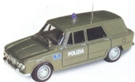
PK 172 - Alfa Romeo Giulia Break Polizia - 1966