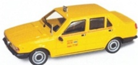
PK 273 - Alfa Romeo Giulietta Taxi Roma - 1977