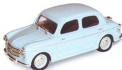
PK 181 - Fiat 1100/103 E Stradale - 1953