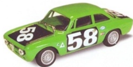
PK 2062 - Alfa Romeo Giulia GTA Trans AM - 1968