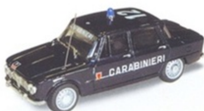
PK 108D - Alfa Romeo Giulia Super Carabiniere P.I. - 1970