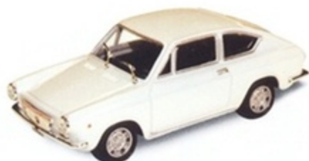
PK 290A - Fiat Abarth 1000 OTS Stradale - 1966