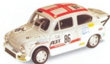
PK 147 - Fiat Abarth 1000 Radiale "ABT" - 1971