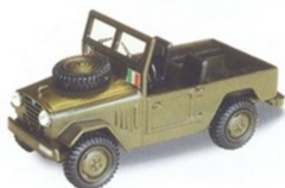
PK 472 - Alfa Romeo AR 51 Matta Carabinieri Open - 1950