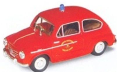
PK 159 - Fiat 600 D Vigili Del Fuoco - 1959