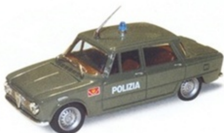
PK 101C - Alfa Romeo Giulia Berlina Polizia Rep. Mobile - 1968