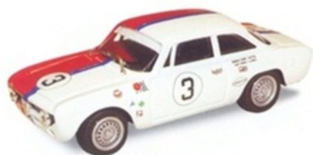
PK 2061A - Alfa Romeo Giulia GTA Trans AM N.6 - 1967