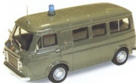
PK 342B - Fiat 238 Pulmino Polizia - 1965