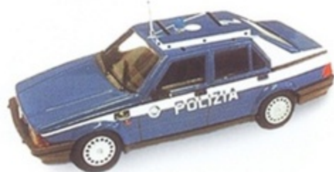
PK 194C - Alfa Romeo 75 Polizia Autoveloce - 1987