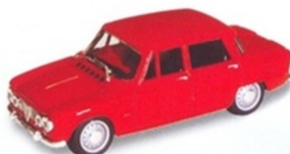
PK 100 - Alfa Romeo Giulia Berlina 1600 Stradale - 1962