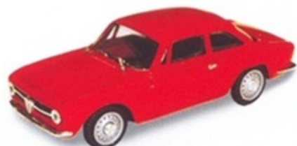
PK 096 - Alfa Romeo Giulia GT Junior 1300 Stradale - 1970