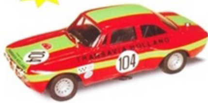
PKRAC 007 - Alfa Romeo Giulia GTAM Transavia Zandvoort - 1972