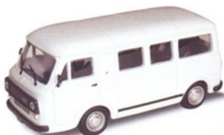
PK 370 - Fiat 238 E Minibus Stradale - 1970