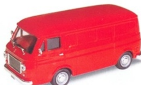
PK 350 - Fiat 238 Furgone Stradale - 1965