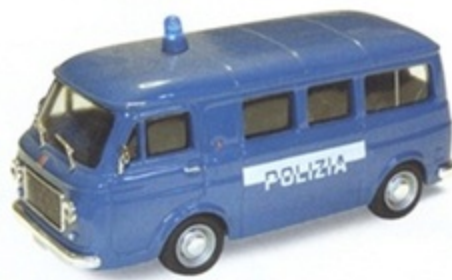
PK 342 - Fiat 238 Pulmino Polizia - 1970