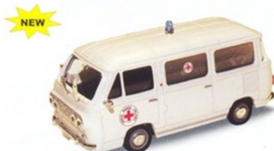
PK 486 - Fiat 850 Familiare Croce Rossa Italiana - 1968