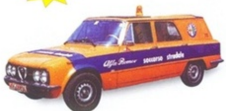
PK 404 - Alfa Romeo Nuova Giulia Break Soccorso Stradale