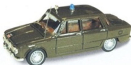
PK 108E - Alfa Romeo Giulia Berlina Carabiniere - 1965