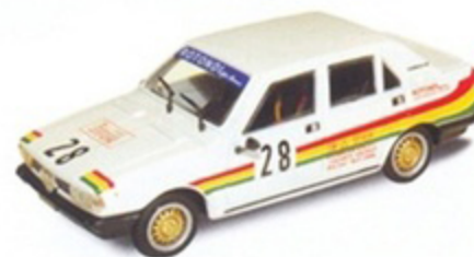
PK 2042 - Alfa Romeo Giulietta Campionato Turismo - 1977