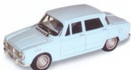
PK 098 - Alfa Romeo Giulia 1300 TI Stradale - 1964