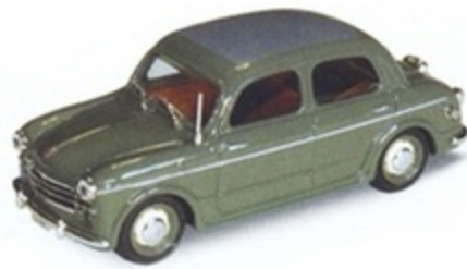
PK 184A - Fiat 1100/103 Polizia Stradale - 1955