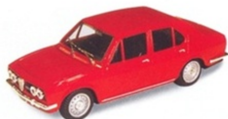
PK 210 - Alfa Romeo Alfetta 1800 Berlina Stradale - 1972