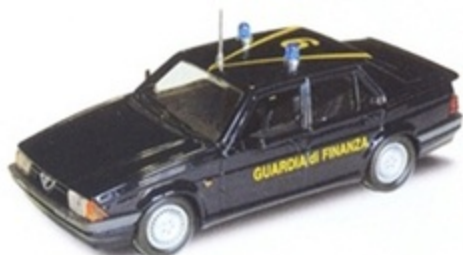
PK 201 - Alfa Romeo 75 T.S. Guardia Di Finanza - 1987