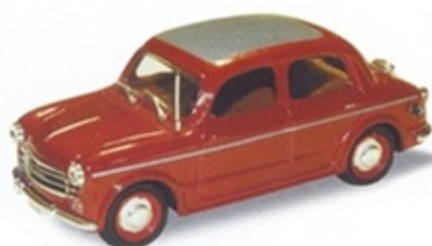
PK 184C - Fiat 1100/103 Polizia - 1953