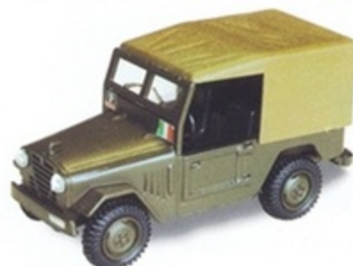
PK 472A - Alfa Romeo AR 51 Matta Carabinieri Chiusa - 1950