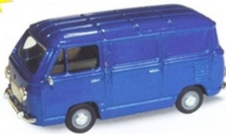
PK 490 - Fiat 850 T Furgone Stradale 1970