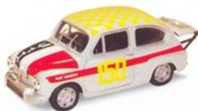
PK 123 - Fiat Abarth 1000 TC Stallavena - Bosco... - 1967