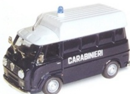
PK 322 - Alfa Romeo Romeo F12 Tetto Alto Furgone Carabinieri - 1968