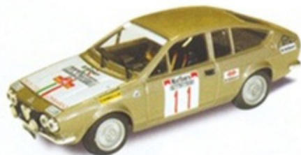
PK 2033 - Alfa Romeo Alfetta Coupè GR Rally Elba - 1976