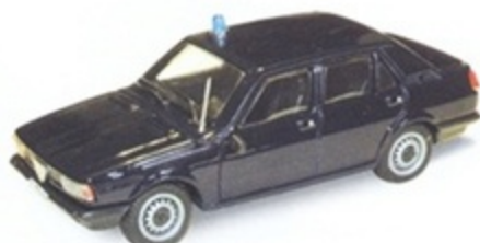
PK 275 - Alfa Romeo Giulietta Carabinieri Auto Servizio - 1977