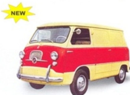
PK 550 - Fiat 600 T Coriasco Furgone Stradale - 1950