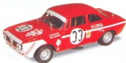
PK 2060 - Alfa Romeo Giulia GTM Jarama - 1972