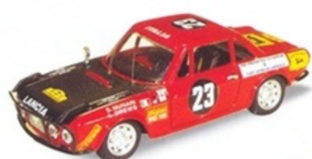
PK 2022 - Lancia Fulvia Coupè HF Safari - 1970