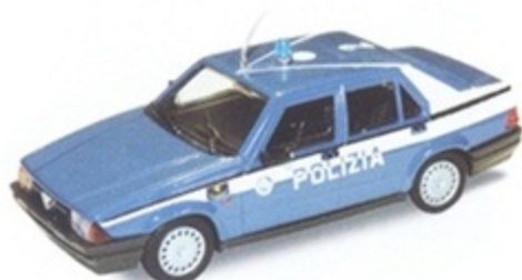
PK 194 - Alfa Romeo 75 1600 Polizia - 1987