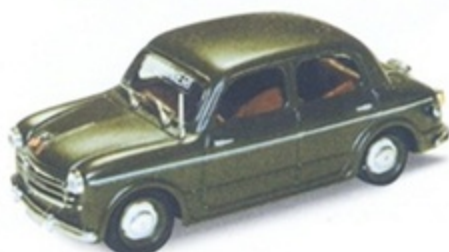
PK 183A - Fiat 1100/103 Carabiniere - 1953