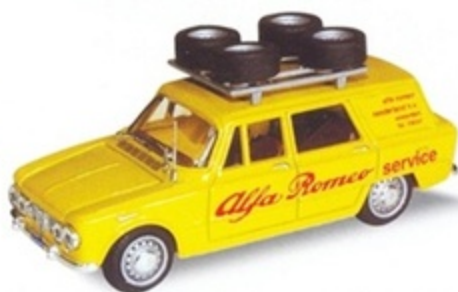
PK 173 - Alfa Romeo Giulia Break Assistenza Alfa Holland - 1967