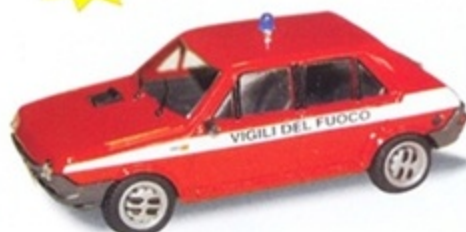
PK 443 - Fiat Ritmo 60 5 Porte Vigili Del Fuoco - 1978