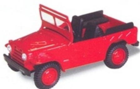
PK 450 - Fiat AR 54 Campagnola Open Stradale - 1950 Rosso