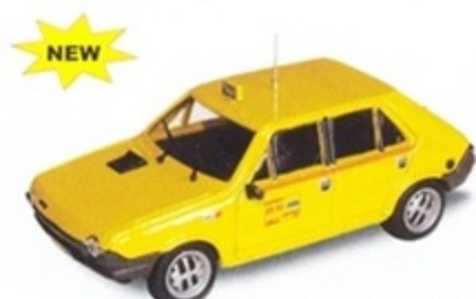
PK 442 - Fiat Ritmo 60 5 porte Taxi di Roma - 1979