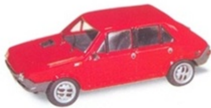
PK 440 B - Fiat Ritmo 60 5 Porte Stradale - 1978