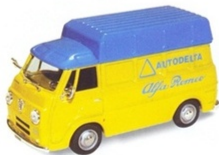
PK 323 - Alfa Romeo Romeo F12 Tetto Alto Ass. Autodelta