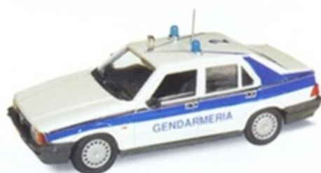
PKC 011 - Alfa Romeo 75 Gendarmenia San Marino - 1977