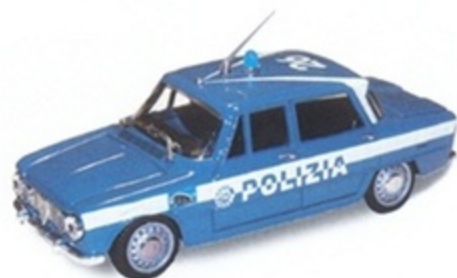
PK 101B - Alfa Romeo Giulia Super Polizia - 1970