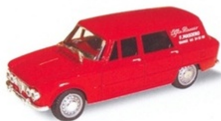
PK 173B - Alfa Romeo Giulia Break Assistenza Masoero - 1971