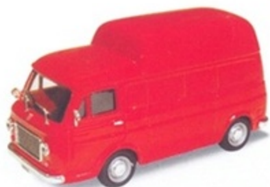
PK 390 - Fiat 238 Tetto Alto Stradale - 1965