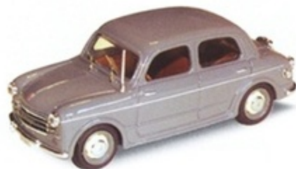
PKC 014 - Fiat 1100/103 Guardia di finanza - 1955