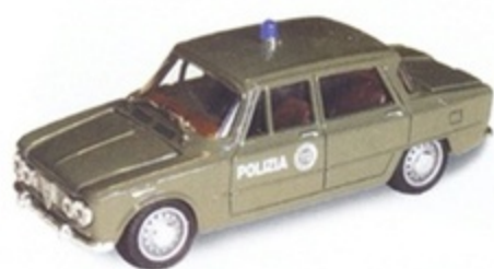
PK 101 - Alfa Romeo Giulia Berlina Polizia - 1962