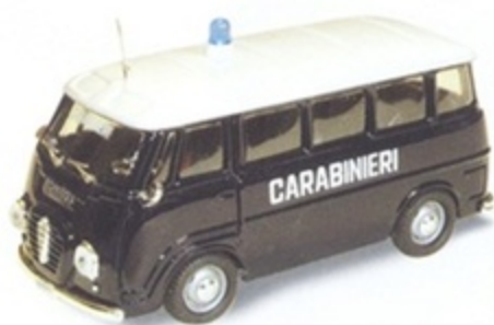
PK 311 - Alfa Romeo Romeo 2 Pulmino Carabinieri - 1968