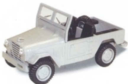
PK 470 A - Alfa Romeo AR 51 Matta Stradale Open - 1951