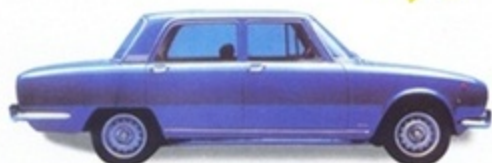
PK 360 - Alfa Romeo 1750 Berlina 1968 - Rosso