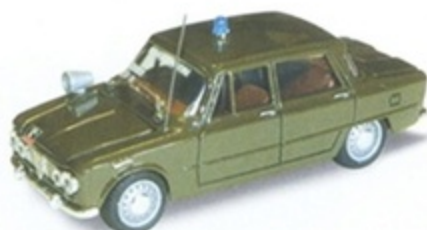
PK 108G - Alfa Romeo Giulia Carabiniere Pronto Int. - 1964