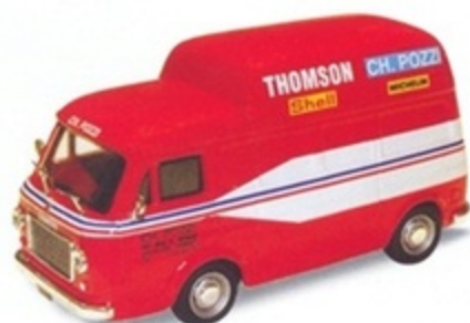
PK 392 - Fiat 238 Tetto Alto Ass.za CH. Pozzi Le Mans - 1978