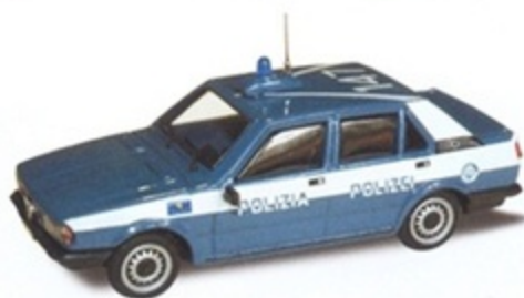
PK 271A - Alfa Romeo Giulietta Polizia - Polizi - 1977