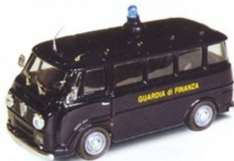
PK 333 - Alfa Romeo Romeo F12 Pulmino Guardia Di Finanza - 1970