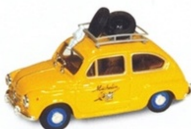
PK 233 - Fiat 600 D Michelin - 1960