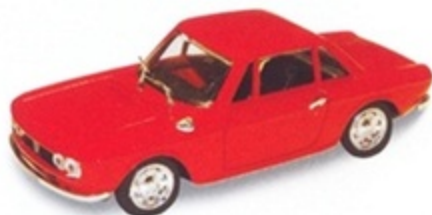
PK 090 - Lancia Fulvia Coupè 3 1300 Stradale - 1974