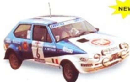
PK 429 - Fiat Ritmo Abarth GR.2 Fiat Montecarlo - 1980