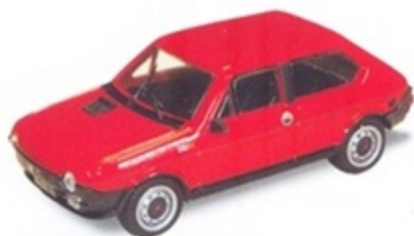
PK 421 - Fiat Ritmo 105 TC Stradale - 1978 Rosso