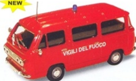
PK 484 - Fiat 850 Familiare Minibus Vigili Del Fuoco - 1970