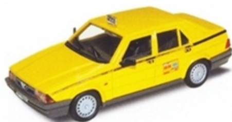
PK 193 - Alfa Romeo 75 Taxi Roma - 1987 PK 193 A - Alfa Romeo Taxi Milano - 1987