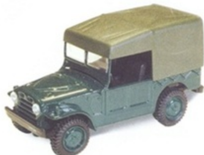
PK 451 - Fiat AR 54 Campagnola Closed Stradale - 1950