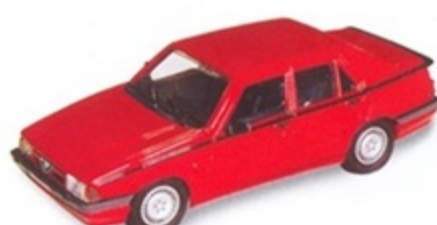
PK 200 - Alfa Romeo 75 Twin Spark Stradale - 1987