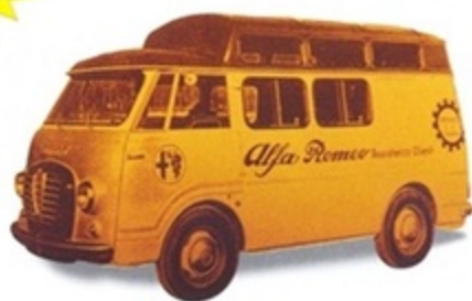
PK 303 - Alfa Romeo Romeo 2 Assistenza Clienti - 1956