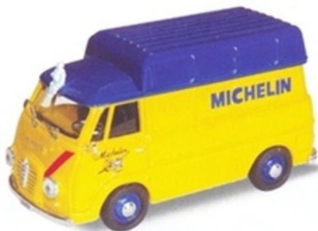
PK 305 - Alfa Romeo Romeo 2 Tetto Alto Furgone Michelin - 1954