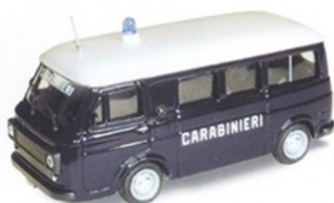
PK 371 - Fiat 238 E Minibus Carabinieri - 1970