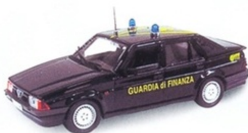
PK 201A - Alfa Romeo 75 T.S. Guardia Di Finanza 117 - 1987