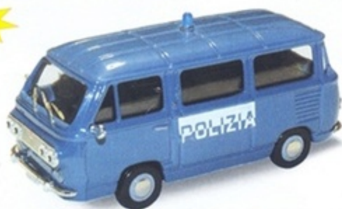
PK 482 - Fiat 850 Familiare Polizia - 1960