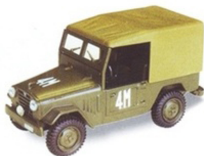
PK 475 - Alfa Romeo AR 51 Matta Mille Miglia - 1951