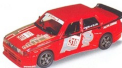
PK 2044 - Alfa Romeo Evoluzione 3 corsa - 1990