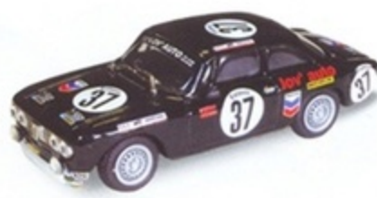
PK 2066 - Alfa Romeo Giulia GTV Spa - 1976