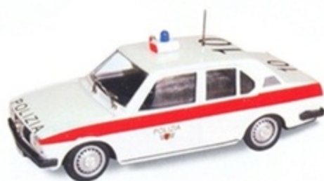
PK 246 - Alfa Romeo Alfetta 2000 Polizia Svizzera - 1977