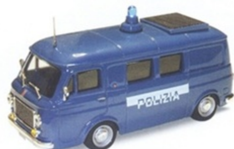
PK 342C - Fiat 238 Promiscuo Polizia Autostradale - 1975