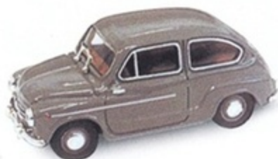
PKC 007 - Fiat 600 D Guardia Di Finanza - 1960