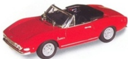
PK 160 - Fiat Dino Spyder Stradale open - 1966 PK 161 - Fiat Dino Spyder Stradale Hard Top - 1966