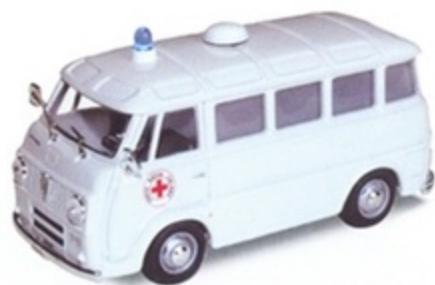
PK 337 - Alfa Romeo Romeo F12 Ambulanza C.R.I. - 1968