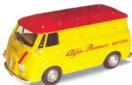
PKC 020 - Alfa Romeo Romeo 2 Furgone Assist. Alfa - 1955