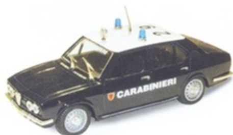
PK 212 - Alfa Romeo Alfetta 1800 Carabinieri - 1972