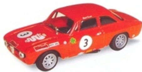
PK 2063 - Alfa Romeo Giulia GTA Trans AM - 1968