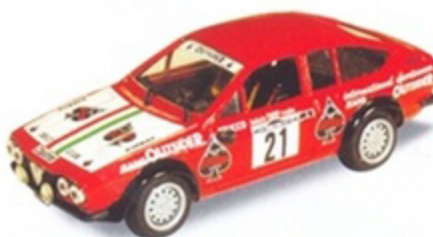
PK 2040 - Alfa Romeo Alfetta GTV Rally Elba - 1977