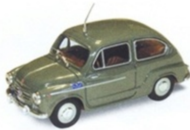
PK 158 - Fiat 600 D Polizia - 1965