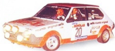
PK 424 - Fiat Ritmo Abarth GR.2 Rally Liburna - 1979