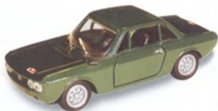
PK 089 - Lancia Fulvia Coupè 3 Montecarlo Stradale - 1974