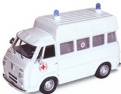
PK 335 - Alfa Romeo Romeo F12 Croce Rossa Italiana - 1965