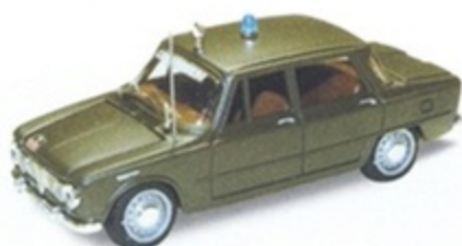
PK 108A - Alfa Romeo Giulia Berlina Carabiniere - 1962