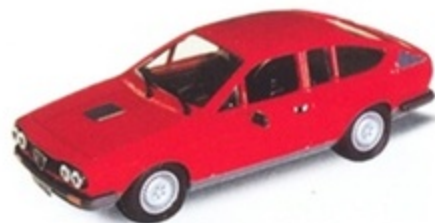
PK 252 - Alfa Romeo Alfetta GTV/6 Stradale - 1978