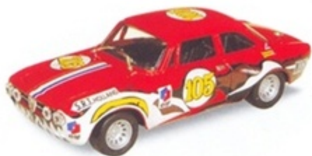
PK 130 - Alfa Romeo Giulia GTAM 2000 Silverstone - 1970