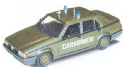
PK 195A - Alfa Romeo 75 Carabinieri Esercito - 1987