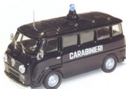
PK 331 - Alfa Romeo Romeo F12 Minibus Carabinieri - 1968