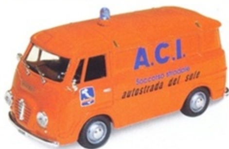
PK 306 - Alfa Romeo Romeo 2 A.C.I. Soccorso Stradale - 1965