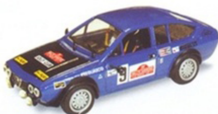
PK 2058 - Alfa Romeo Alfetta Coupè GTV GR.2 Sanremo - 1978