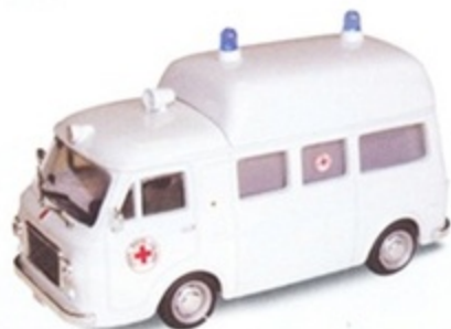
PK 393 - Fiat 238 Tetto alto Ambulanza Croce Rossa Italiana - 1970