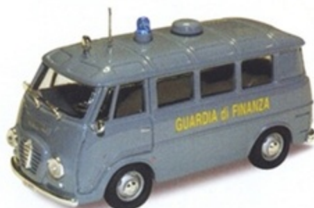
PK 316 - Alfa Romeo Romeo 2 Pulmino Guardia Di Finanza - 1965