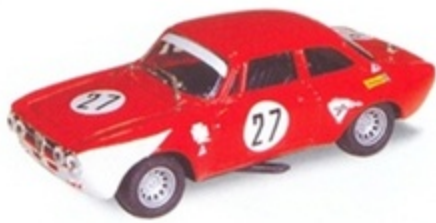
PK 2004 - Alfa Romeo Giulia GTAM 1° Monza - 1971