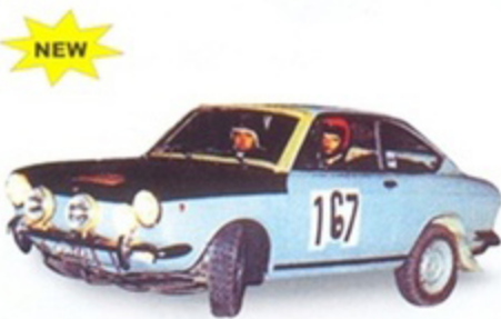
PK 2054 - Fiat 850 Coupè Rally 333 Minuti - 1972