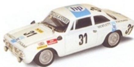
PK 2036 - Alfa Romeo Giulia GTV 2000 Spa - 1977