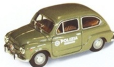
PK 232 - Fiat 750 D Polizia Ferroviaria - 1967