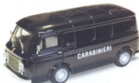
PK 351 - Fiat 238 Furgone Carabinieri - 1968