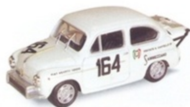
PK 122 - Fiat Abarth 1000 TC Mugello - 1966