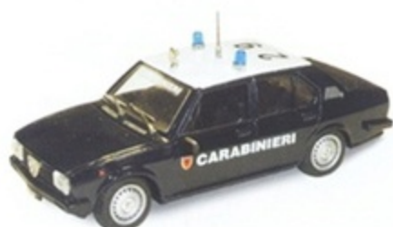
PK 241 - Alfa Romeo Alfetta 2000 Carabinieri - 1977