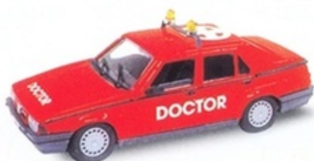
PKC 025 - Alfa Romeo 75 Assistenza Medica Monza - 1980