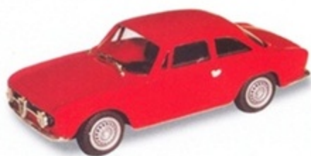
PK 040 - Alfa Romeo Giulia GT Junior Stradale - 1963