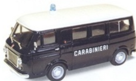
PK 341 - Fiat 238 Pulmino Carabinieri - 1968