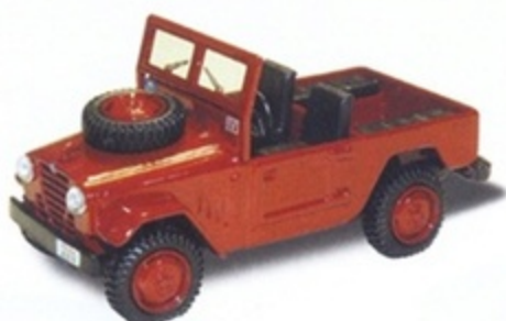
PK 473 - Alfa Romeo AR 51 Matta Polizia Stradale - 1950