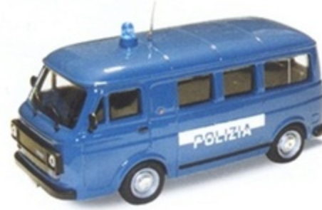
PK 375 - Fiat 238 E Minibus Polizia - 1970