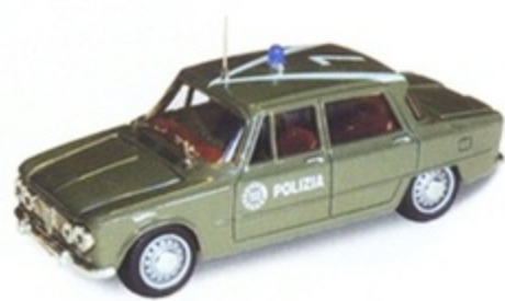
PK 101E - Alfa Romeo Giulia Berlina Polizia 113 - 1968