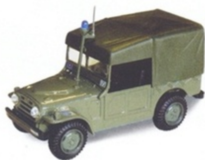
PK 454 - Fiat AR 54 Campagnola Polizia - 1960