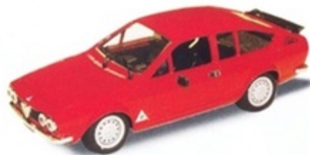
PK 254 - Alfa Romeo Alfetta GTV Autodelta Presentazione - 1976