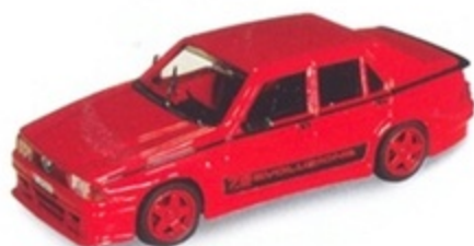
PK 203 - Alfa Romeo 75 Evoluzione stradale - 1987