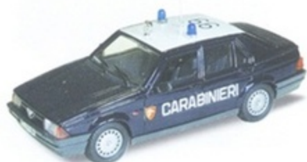
PK 195 - Alfa Romeo 75 Carabinieri - 1987