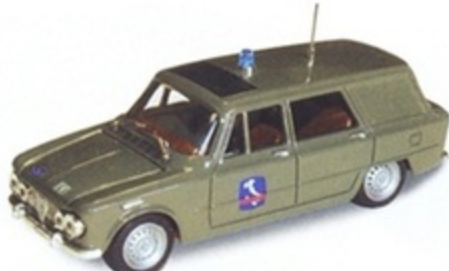
PK 172A - Alfa Romeo Giulia Break Polizia Autostrade - 1966