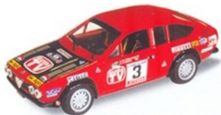
PK 269 - Alfa Romeo Alfetta GTV Turbodelta Costa Brava - 1980