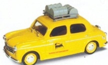
PK 187 - Fiat 1100/103 Agip - 1955