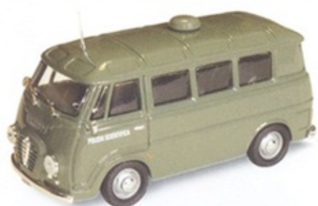
PK 307- Alfa Romeo Romeo 2 Promiscuo Polizia Scientifica - 1968