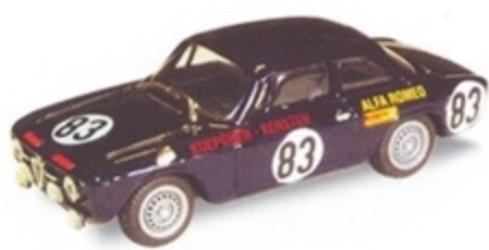
PK 068 - Alfa Romeo Giulia GTJ 1300 Spa - 1968