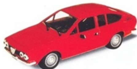
PK 250 - Alfa Romeo Alfetta GTV Stradale - 1974