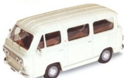
PK 480B - Fiat 850 Familiare Minibus Stradale Avorio