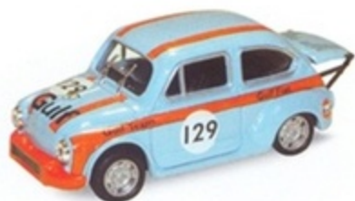
PK 2046 - Fiat Abarth 1000 TC Radiale Gulf Team