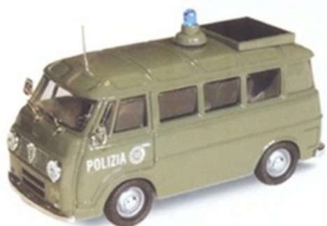
PK 338 - Alfa Romeo F12 Promiscuo 113 Polizia Stradale - 1968