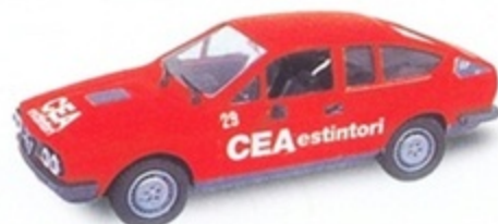
PKC 027 - Alfa Romeo Alfetta GTV CEA Estintori - 1985