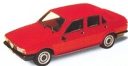
PK 270 - Alfa Romeo Giulietta Stradale - 1977