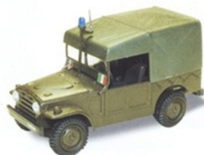
PK 455 - Fiat AR 54 Campagnola Carabinieri - 1950