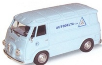
PE 020 - Alfa Romeo Romeo 2 Furgone Assistenza Autodelta - 1960