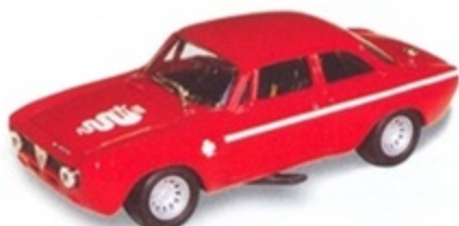
PK 139 - Alfa Romeo Giulia GTAJ Presentazione - 1972