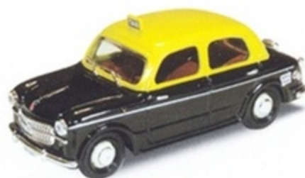
PKC 031 - Fiat 1100/103 Taxi Nuova Delhi