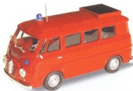
PK 308- Alfa Romeo Romeo 2 Promiscuo Polizia autostrade - 1953