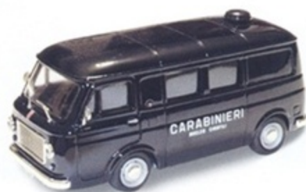
PK 347 - Fiat 238 Promiscuo Carabinieri Cinofili - 1968