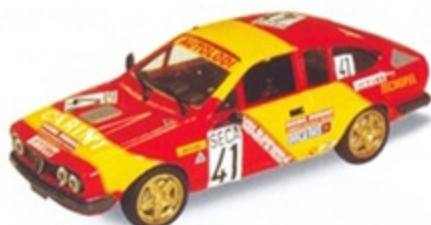
PK 2041 - Alfa Romeo Alfetta Coupè GTV/6 Spa - 1974