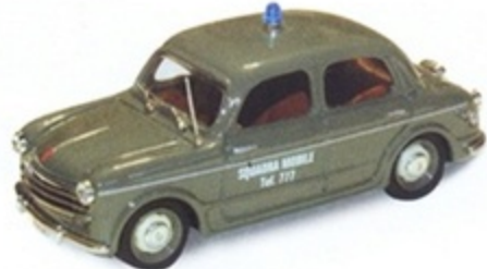
PK 184B - Fiat 1100/103 Polizia Pronto Intervento 777 - 1956