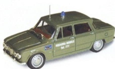
PK 101D - Alfa Romeo Giulia Polizia Pronto Intervento 777 - 1968