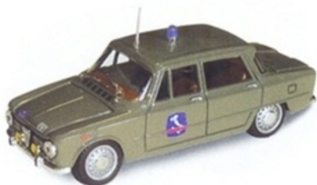
PK 101F - Alfa Romeo Giulia 1300 TI Polizia Autostradale - 1969