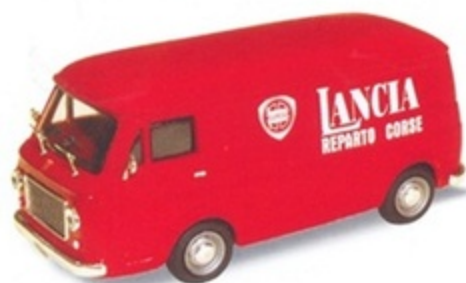
PK 354 - Fiat 238 Furgone Assistenza Corse Lancia - 1971