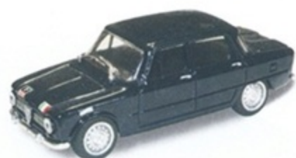
PK 108C - Alfa Romeo Giulia 1300 Carabiniere - 1968