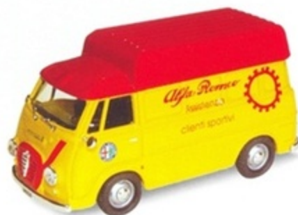
PK 302 - Alfa Romeo Romeo 2 Tetto Alto Ass. Alfa - 1954