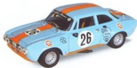
PK 2065 - Alfa Romeo Giulia GTM Gulf Team