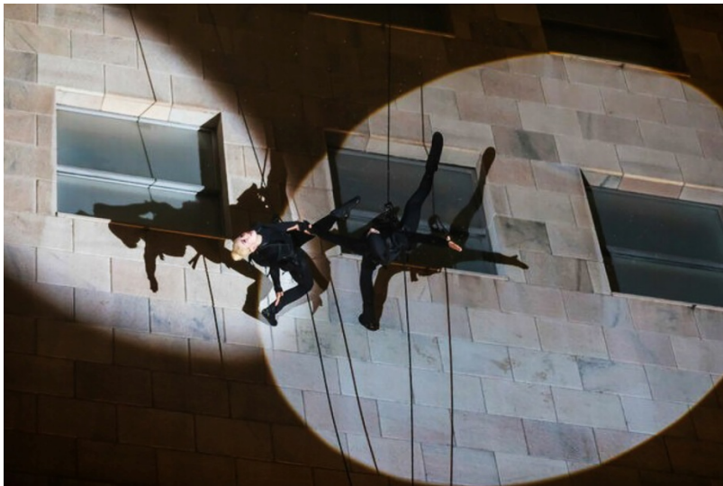
La spettacolare performance acrobatica sulla facciata del department store

Il party, al settimo piano del department store, è stato preceduto da una stupefacente performance all'esterno, che inscenava un furto in pieno stile Re del Terrore: due attori-acrobati, con le fattezze di Diabolik e dall'affascinante compagna Eva Kant, si sono calati sulla facciata della Rinascente, in una danza acrobatica sospesa, tra fumogeni, suoni di sirene ed effetti speciali, i due impareggiabili ladri hanno scassinato una grande cassaforte antistante l'ingresso dello store, rivelandone il contenuto: l'inedito fumetto intitolato "Colpo alla Rinascente", nel quale Diabolik, vestendo i panni dell'amministratore delegato di Rinascente Pierluigi Cocchini, riesce a penetrare nel punto vendita e a svaligiarne il caveau.