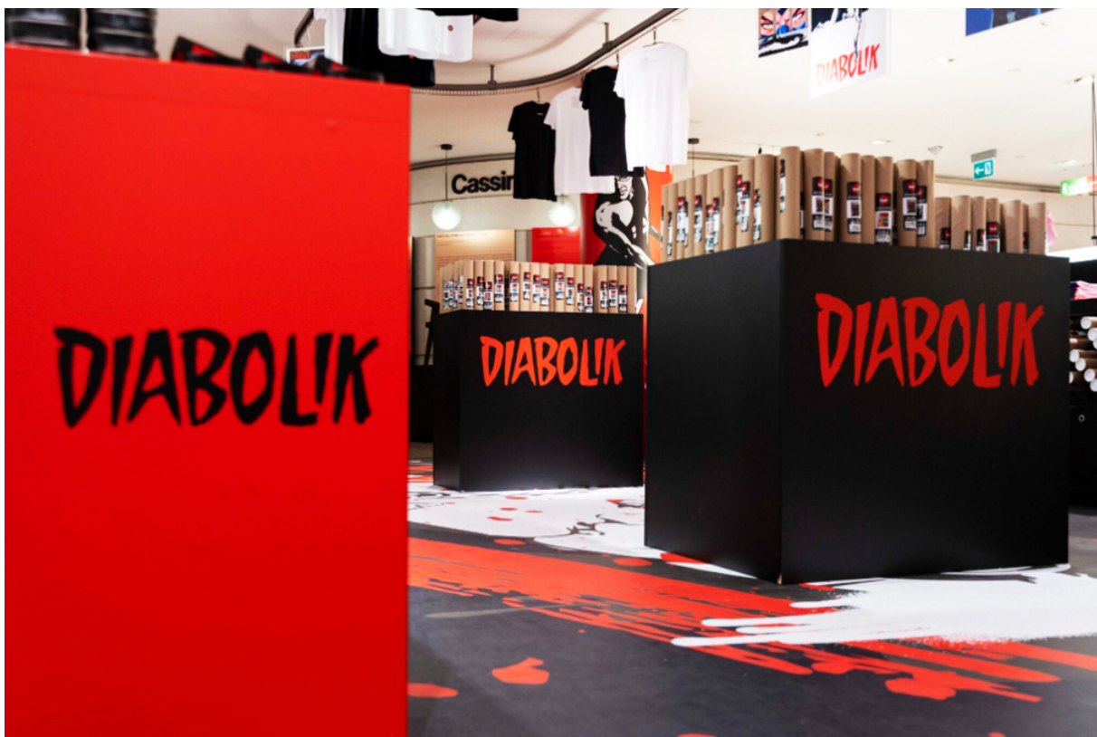
L'area Air Snake al Design Supermarket è stata dedicata al Re del Terrore, con un'offerta di merchandising composta da oggetti celebrativi e da collezione