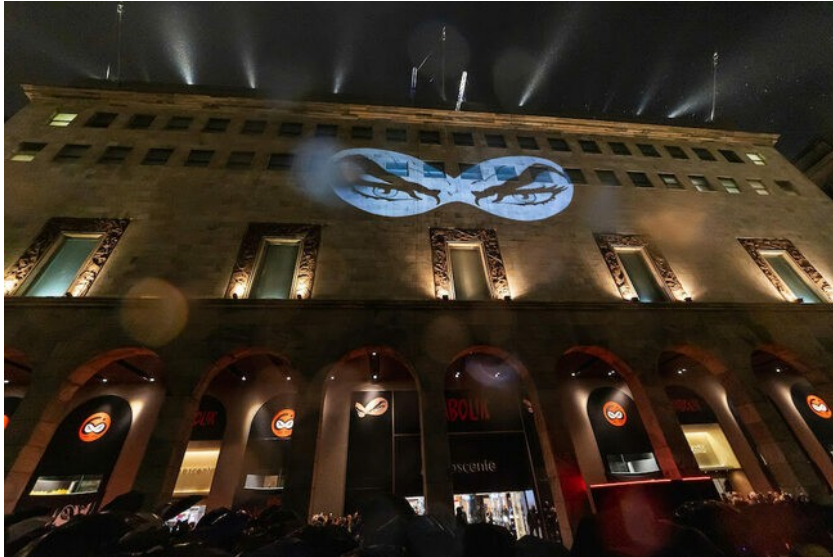
La Rinascente di Piazza Duomo a Milano festeggia in grande stile il 60esimo compleanno di Diabolik

In una giornata di pioggia, che ha creato la giusta atmosfera, la Rinascente di Piazza Duomo a Milano ha organizzato un party esclusivo per la sera del 3 novembre per festeggiare degnamente il 60° anniversario della nascita di Diabolik, il celebre fumetto noir creato nel 1962 dalle sorelle milanesi Angela e Luciana Giussani (prima uscita 1° novembre 1962).