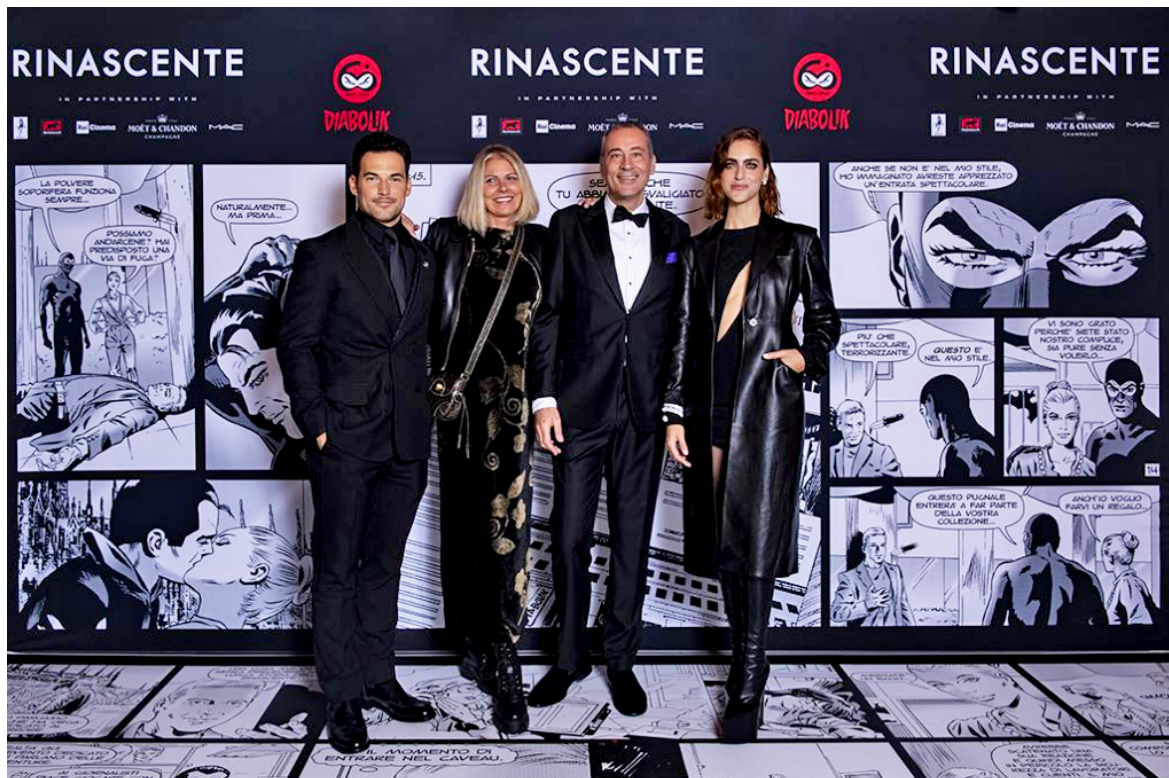
Sono intervenuti alla serata i protagonisti del nuovo film DIABOLIK: Giacomo Gianniotti e Miriam Leone. Il film sarà nelle sale il 17 novembre