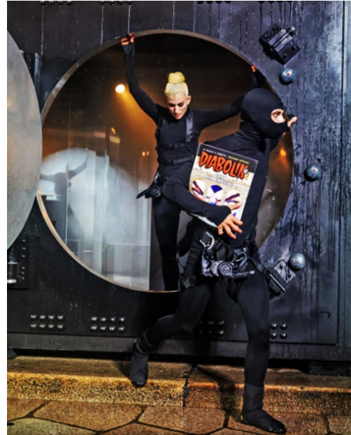
Svaligiata la cassaforte in pieno stile "Re del Terrore"