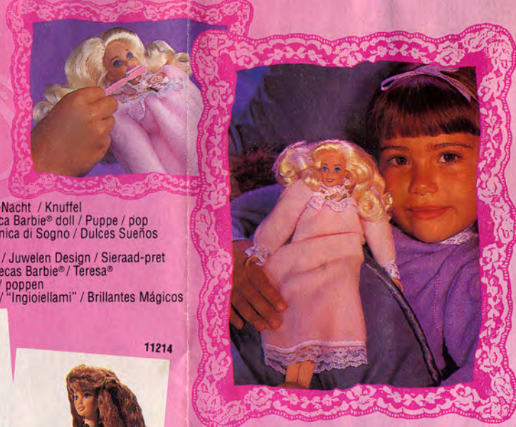
Bedtime / Gute-Nacht / Knuffel Poupée / muñeca Barbie® doll / Puppe / pop Douce Nuit / Amica di Sogno / Dulces Sueños