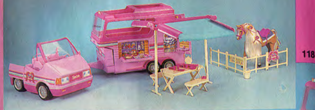
Horse Trailer Camping Car Equestre Pferde Luxus Trailer Il Trailer delle Meraviglie Paard-en Kampeertrailer Caravana con Remolque