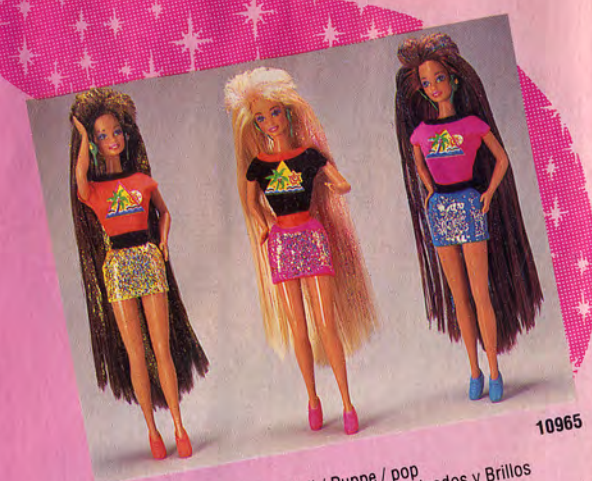
Glitter Hair Poupée / muñeca Barbie® doll / Puppe / pop Chevelure Scintillante / Chiomabrilante / Peinados y Brillios