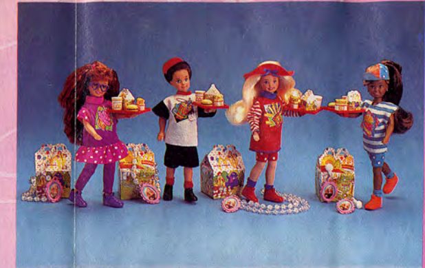
Happy Meal™ Poupées / muñecos Stacie® / Todd® / Laura a.k.a. Whitney™ / Janet® McDonald's dolls / Puppen / poppen. * Whitney in the U.S. & Canada