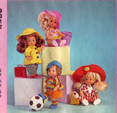
AAE49 AAE50 AAE51 AAE52